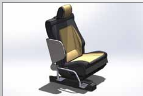
POSIZIONE DI RIPOSO

TURBO SLIDE facilita il trasferimento da e verso la carrozzina. Il suo sistema di rotazione consente di riporlo al lato del sedile in posizione di riposo.