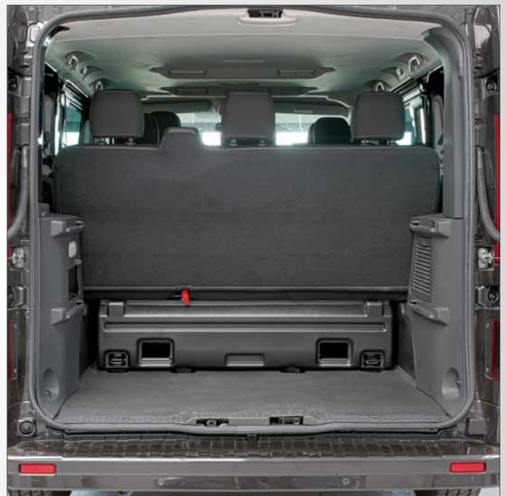
Rivestimenti delle panchette originali di seconda e terza fila nella versione base 9 posti viaggio.

OMOLOGAZIONI L'ufficio omologazioni di Focaccia Group è in contatto diretto con i maggiori Costruttori e dialoga con il Ministero dei Trasporti, garantendo il pieno rispetto delle normative ed i canoni costruttivi di sicurezza della Casa Madre anche nei collaudi in unico esemplare.