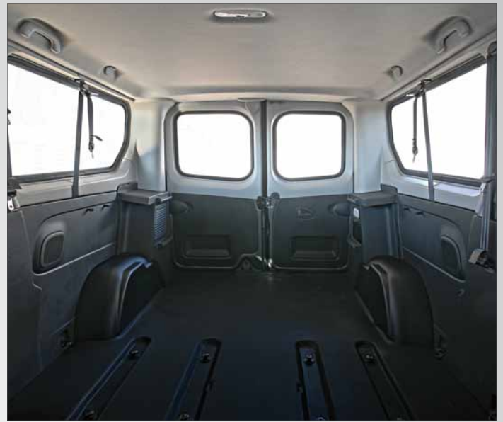
Kit rivestimenti in ABS termoformato per passaruota, cornici finestrini e porta posteriore (a battente o basculante).