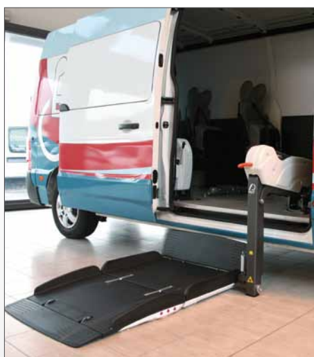
Sollevatore Fiorella Slim Fit F360 EX