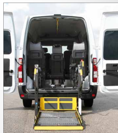
Sollevatore Doppio Braccio

Renault Master può essere allestito per trasporto persone con disabilità con sollevatore Fiorella Slim Fit nelle versioni F360 (la versione standard con piattaforma di dimensioni 1030x714 mm) e F360 EX (la versione Extended con piattaforma di dimensioni 1075x765 mm, più grande e adatta anche al trasporto delle carrozzine più ingombranti). Entrambe le versioni del sollevatore Fiorella Slim Fit possono essere installate anche sul vano d'ingresso laterale di Renault Master.