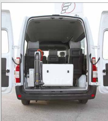
Sollevatore Fiorella Slim Fit F360